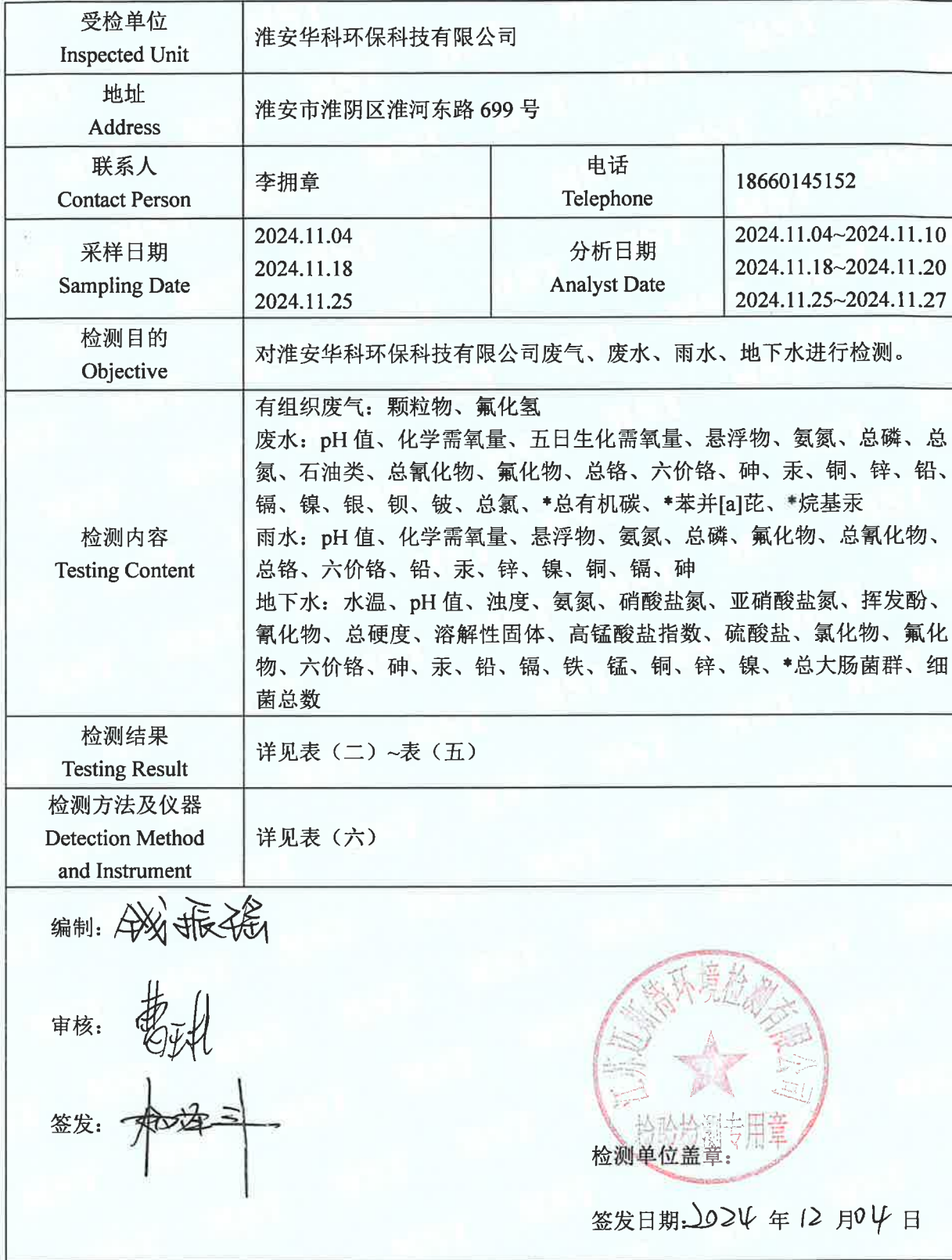
表 (一) 项目概况说明